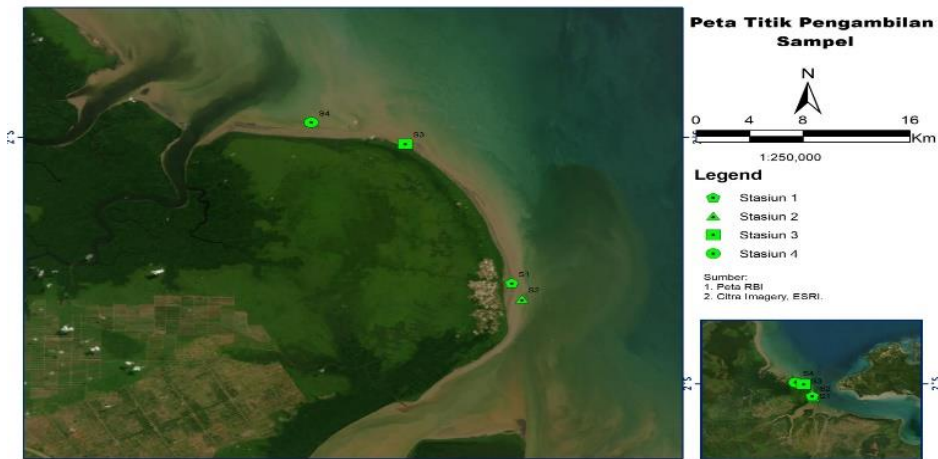
Gambar 1. Peta lokasi penelitian