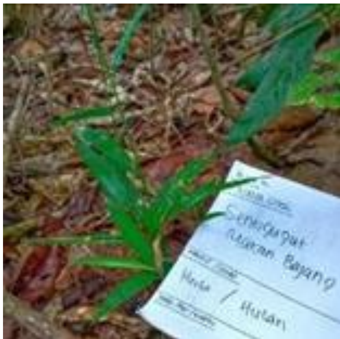
Sengugut makan bajang ( Lophatherum gracile Brogn.)

Kemudian menurut penelitian farmakologi China yaitu Jing [14], ekstrak daun Lophatherum gracile Brogn. mengandung senyawa aktif flavonoid dan triterpenoid yang dapat dimanfaatkan sebagai antibakteri, diuretik, antitumor dan efek hiperglikemia.