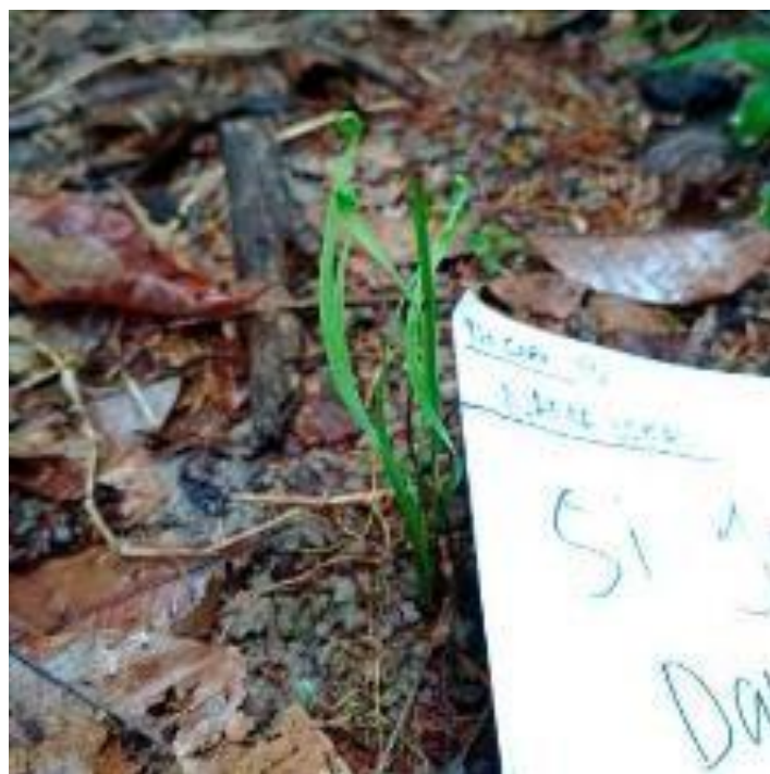
Si jago dalu ( Actinostachys digitata (L.))

Pada masyarakat Suku Anak Dalam di Desa Sungai Jernih menggunakan seluruh organ dari tumbuhan ini sebagai obat penambah stamina bagi laki-laki (lemah syahwat) dengan cara tumbuhan dibersihkan lalu direbus dengan 2 gelas air hingga menjadi 1 gelas, diminum pagi setelah bangun tidur dan malam sebelum tidur. Sejauh ini belum ditemukannya penelitian mengenai kandungan kimia yang terdapat pada tumbuhan Actinostachys digitata (L.) sebagai obat, sehingga belum diketahui senyawa apa saja yang terkandung dalam tumbuhan ini dan berperan sebagai obat sehingga mampu menyembuhkan suatu penyakit.